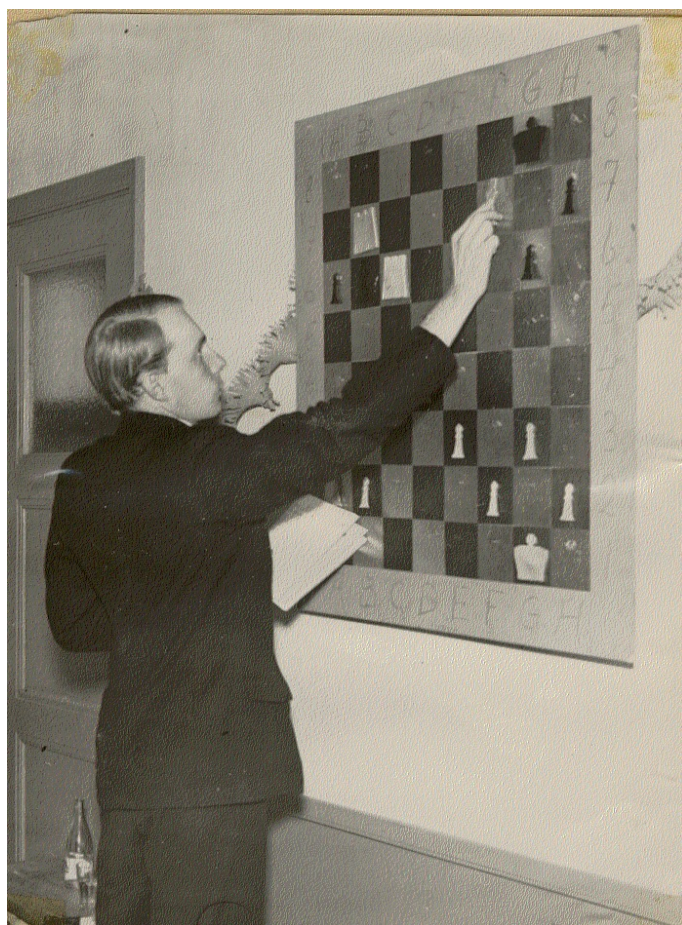
Gideon Ståhlberg ger en teorilektion 1932.

Det började med att Gideon Ståhlberg höll en teorilektion 1932. På senare år har denna verksamhet blivit mer regelbunden. Schackföreläsningar har anordnats i klubblokalen med både interna och externa föreläsare. Under pandemin blev föreläsningarna digitala.